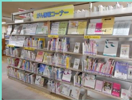
がん情報コーナー がん関連図書約 500 冊あり